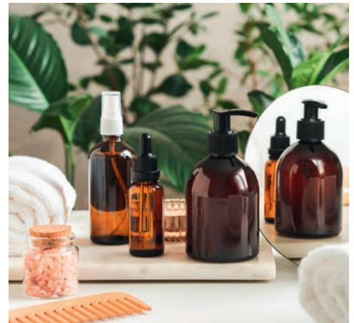
Gestalten Sie die Ausstattung Ihres Kosmetikinstituts nachhaltig mit natürlichen Materialien und wiederauffüllbaren Gefäßen.

Die Integration von Nachhaltigkeit in Ihr Kosmetikinstitut bringt nicht nur ökologische, sondern auch wirtschaftliche Vorteile mit sich. Kunden legen heute großen Wert auf ethische Werte und belohnen Unternehmen, die diese teilen. Indem Sie sich klar positionieren, können Sie auch neue Zielgruppen erschließen. Gerade die jüngeren Generationen (Millennials und Gen Z) achten bei ihren Kaufentscheidungen auf Nachhaltigkeit. Ein umweltbewusstes Institut wird außerdem als modern und verantwort-