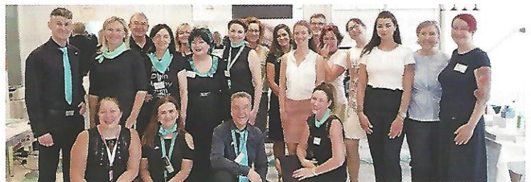
Das Team der Vital Kosmetikakademie öffnete am 31. August die Türen für Besucher.

Tel. 030 21478730, www.vital-kosmetikakademie.de